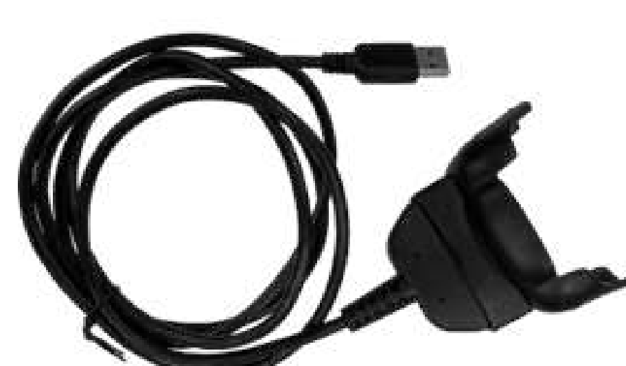
Зарядка-клипса K8, P/N: CHA-BTC-K8 длина 1.2 м