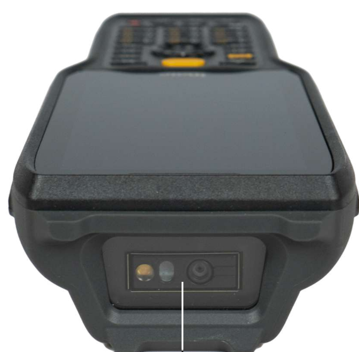
Сканирующий модуль iData DS7000 Pro