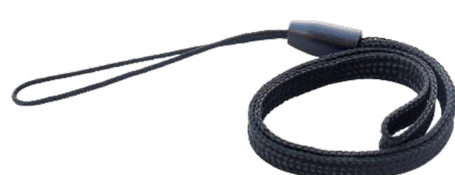
Ремень на запястье P/N: MNT-HS-GNR