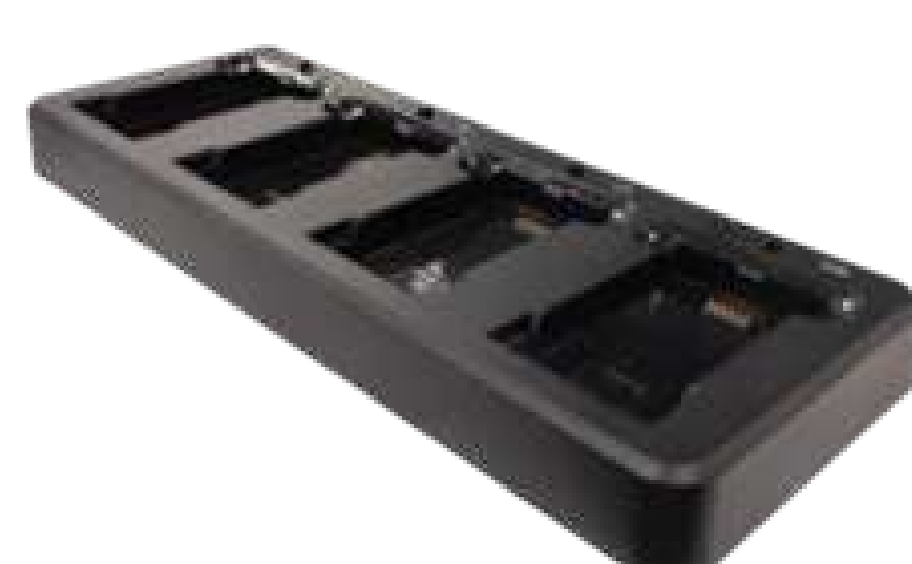
Зарядный кредл для 4х аккумуляторов K8 P/N: CHA-CRD4B-K8 Код на портале: 1912 В комплекте кабель 1.5 м, блок питания