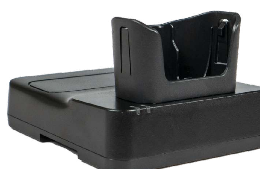
Зарядный кредл для K8 P/N: CHA-CRD1S-K8 Код на портале: 2146 В комплекте кабель 1.2 м, блок питания