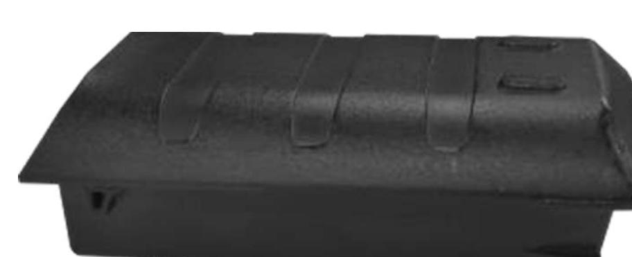
Аккумулятор для K8 P/N: CHA-BTRY-K8-6700MA Код на портале: 1914