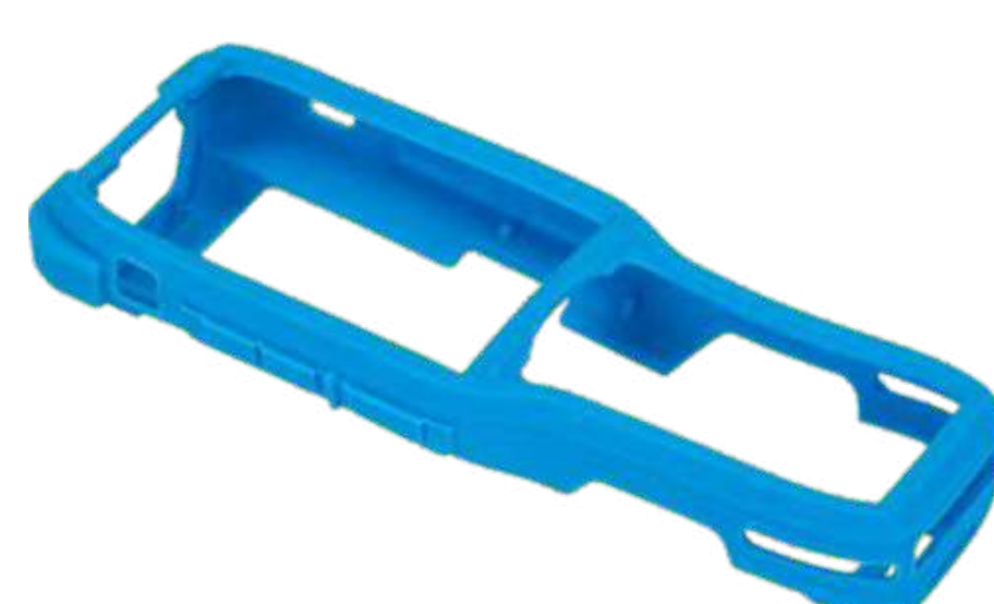
Защитный чехол для K8 P/N: PRT-PTC-K8 Код на портале: 1913