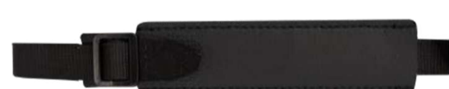
Ремень для ладони P/N: MNT-BS-K8