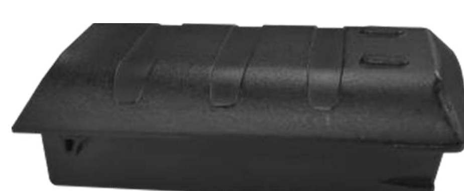
Аккумулятор P/N: CHA-BTRY-K8-6700 MA6700 мАч, 3.85 В