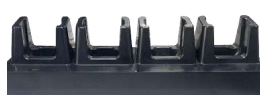
Зарядный кредл для 4х K8 P/N: CHA-CRD4S-K8 Код на портале: 2318 В комплекте кабель 1.5 м, блок питания