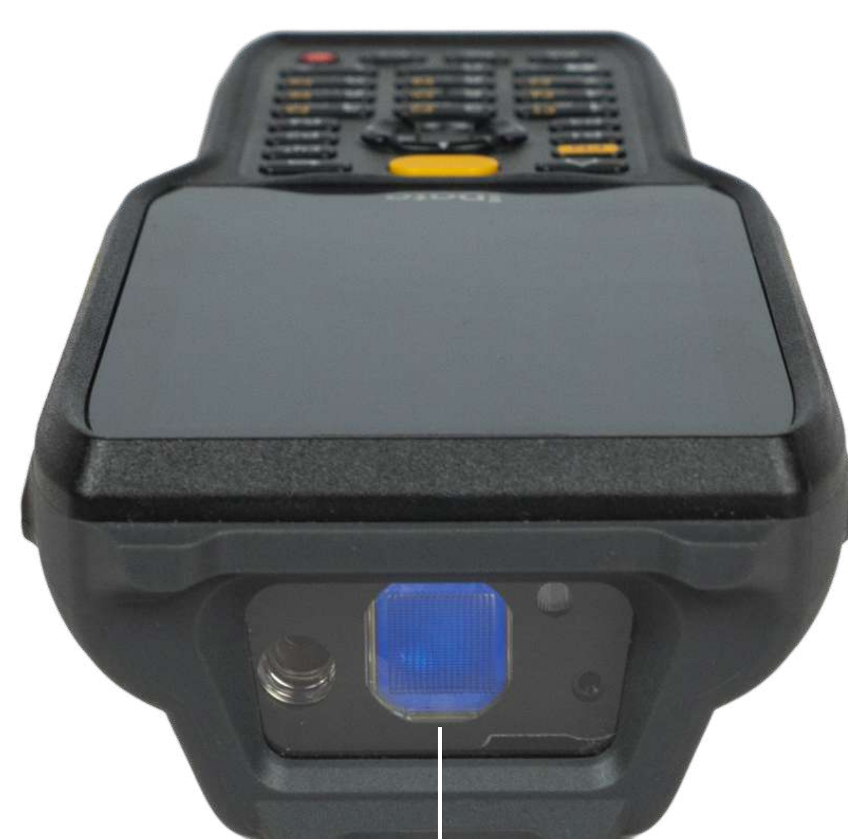
Дальнобойный сканирующий модуль Zebra SE4850