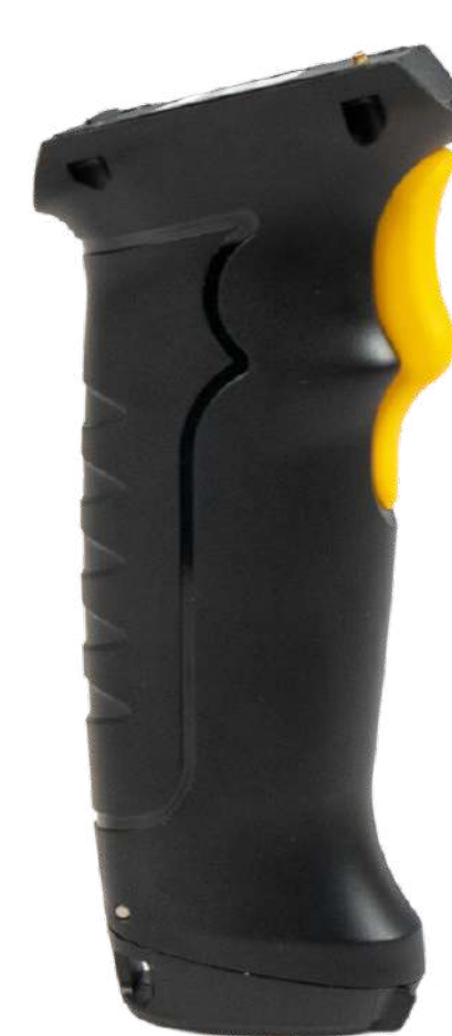
Пистолетная рукоять для K8 P/N: CHA-BTC-K8 Код на портале: 1735