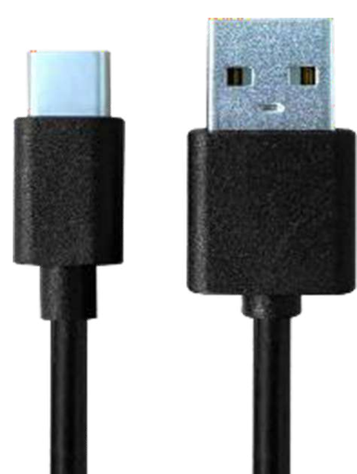
Кабель USB-A - USB Type-C P/N: CHA-USBC-GNR Длина 1 м, для зарядки АКБ и передачи данных