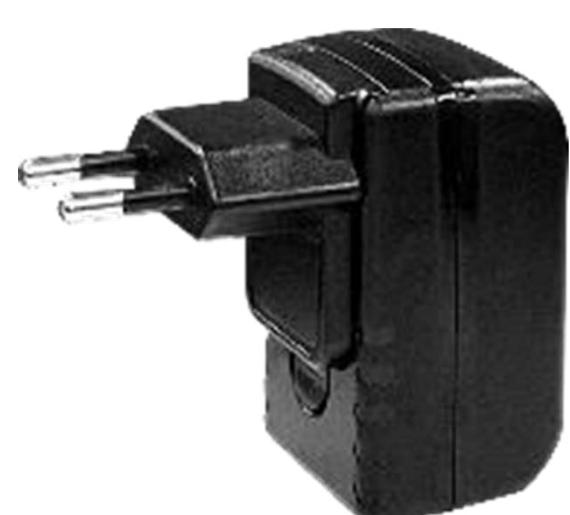
Блок питания P/N: CHA-PWAD-GNR-5V2A-EU Вход 100-240В, 0.4А Выход 10 Вт, 5В, 2А