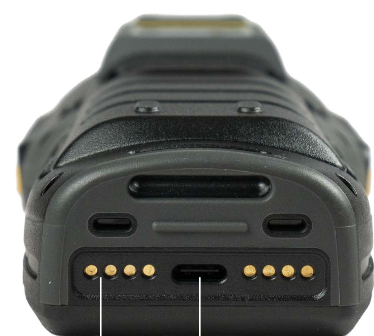
Pin контакты для крепления аккумулятора USB Type-C