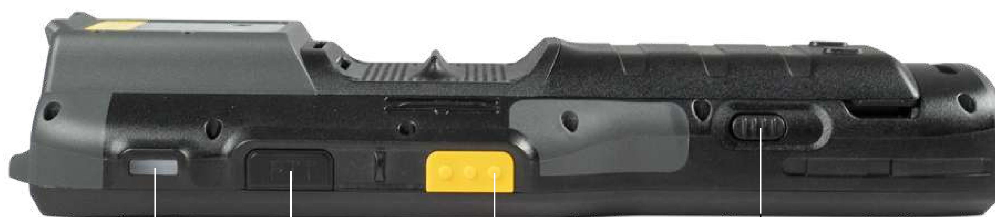
LED-сигнал сканирования Клавиша Push-To-Talk Клавиши сканирования Кнопка фиксации аккумулятора