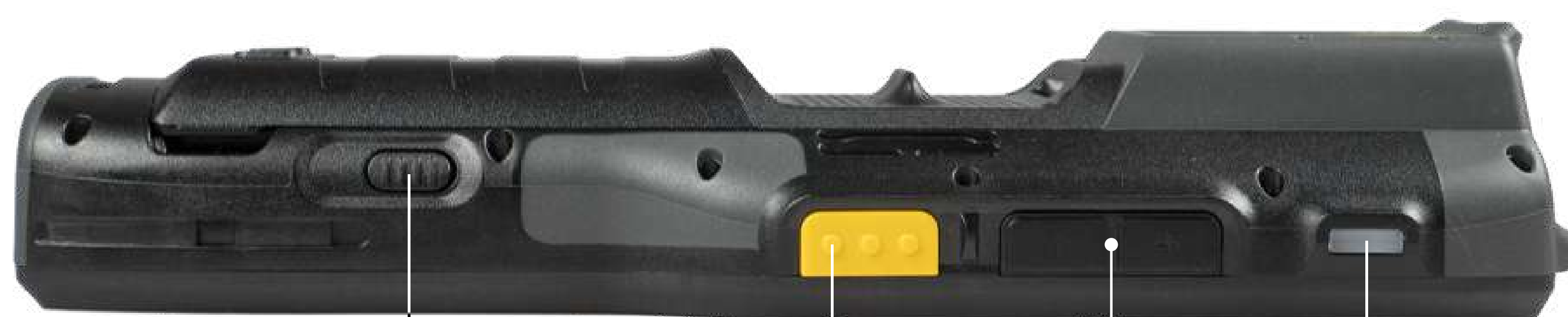
Кнопка фиксации аккумулятора Клавиши сканирования Клавиши регулировки громкости LED-сигнал сканирования