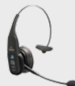
■ 94ACC0127 Гарнитура Bluetooth VXI B350-XT