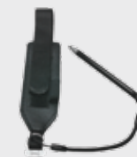
■ 94ACC0133 Ремень на запястье (включён в комплектацию)