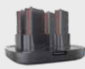
■ 94ACC0192 зарядное устройство на аккумулятора