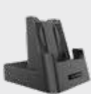
■ 94A150095 однослотовая док-станция